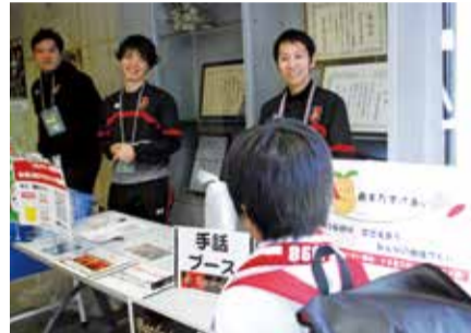
デフィオの選手の笑顔

また、「バセ(U-15カテゴリー)」が12月1日(金)の街頭募金と試合後の募金活動に協力してくれました。