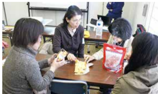
防災食を切り分けながら講演内容を振り返って真剣に話し合うママたち