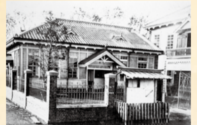
浦安町役場福祉課内に事務局を設置

昭和63年4月 事務所を市役所庁舎内から浦安市総合福祉センターへ移転 うらやす社協が千葉県共同募金会浦安市支会の事務局に うらやす社協が民生委員児童委員協議会の事務局に うらやす社協が保護司連絡協議会の事務局に 母子福祉センター管理委託業務開始 地域福祉センター管理委託業務開始