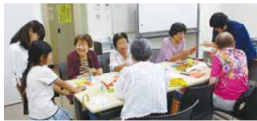
自然と笑みがこぼれます

毎月第3金曜日の午後1時30分から3時30分まで季節に合わせた小物を作ったり、生活に役立つ講座を開催しています。