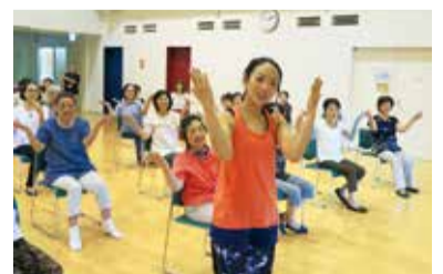
いろいろなダンスを覚えよう(自由参加教室)