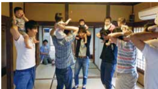
ふれあい遊びで「たかいたか〜い」