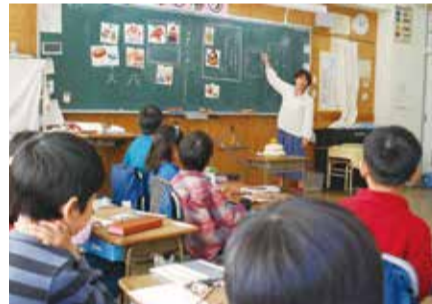
先生の説明を聞く姿は真剣