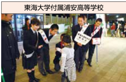
東海大学付属浦安高等学校