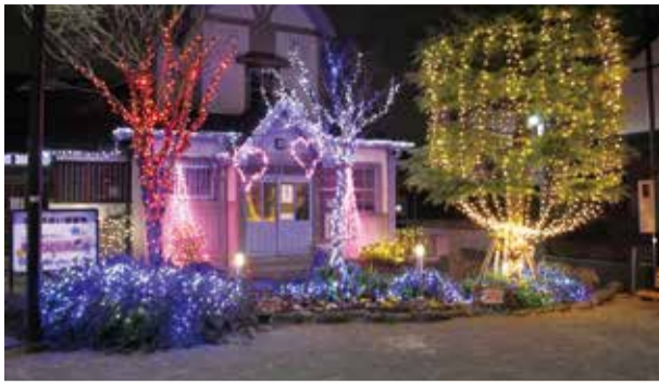
幻想的なイルミネーション

多くの方が来られて賑わい始めました。イルミネーション点灯の前後には、クリスマスソングの演奏も行われ、会場は幻想的な雰囲気につつまれました。そして、みなさんと声を合わせたカウントダウン、点灯時にはお子さんたちから「ついた! ついた!!」「きゃ〜! すごいすごい!!」「きれいだね!」と歓声が上がリ、その日一番の盛り上がりを見せました。