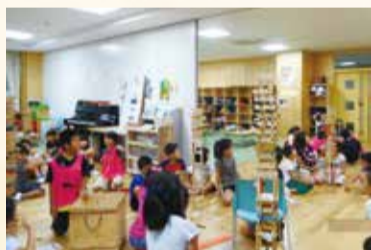
東野小学校地区児童育成クラブ