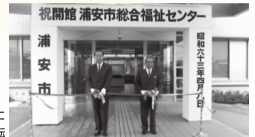
浦安市総合福祉センターに 事務局を移転