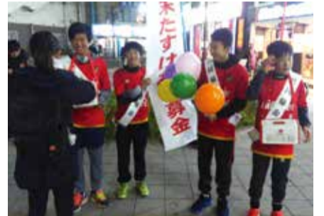
バセが募金活動中！