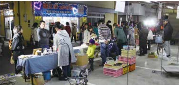
地元商店等の出店ブースは大賑わい(点灯式当日の堀江ぽっかぽか前)

今回で4回目を数えるクリスマスイルミネーション。うらやす社協では、これからも地元自治会や商店などのご協力のもと、地域交流に取り組んでまいります。