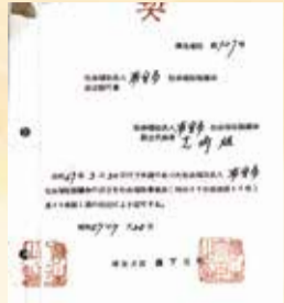
社会福祉法人設立認可書