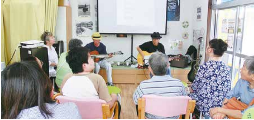
大きな声を出して歌っています!