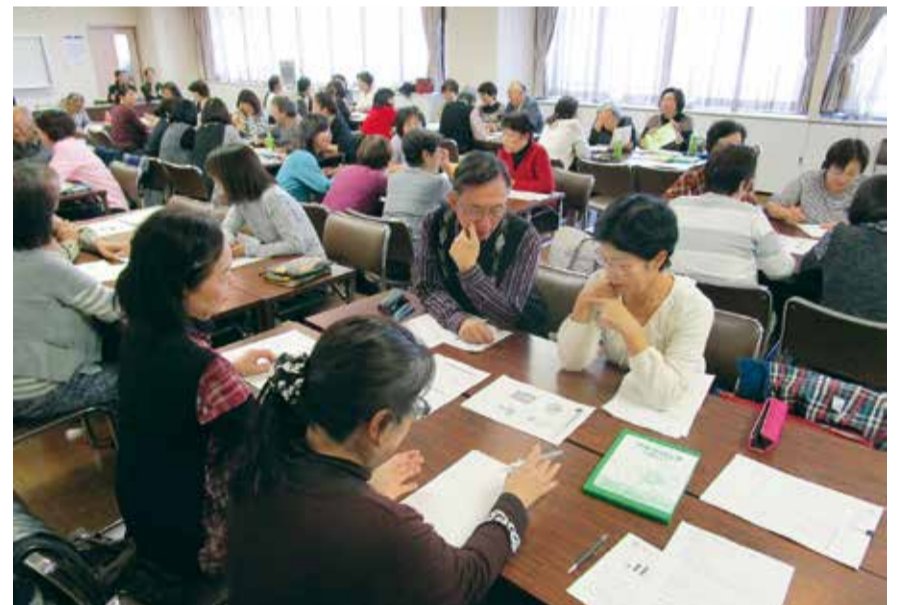
どのドリルを選択して実習するか、相談中!

うらやす社協では今後、地域での高齢者サロンがより一層面白く、また一日でも長く健康でいられるような活動の支援をしてまいります。