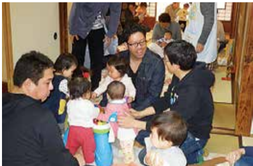
パパ同士、子育てあるあるで共感しあえる