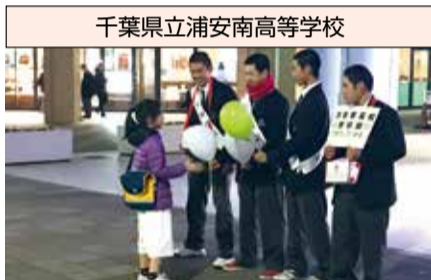
千葉県立浦安南高等学校