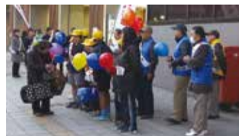
最良のコンビネーション