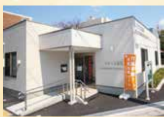
富岡地域包括支援センター (ともづな富岡)