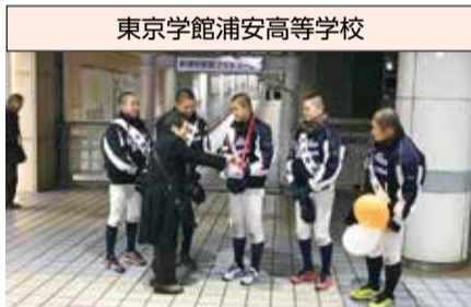
東京学館浦安高等学校