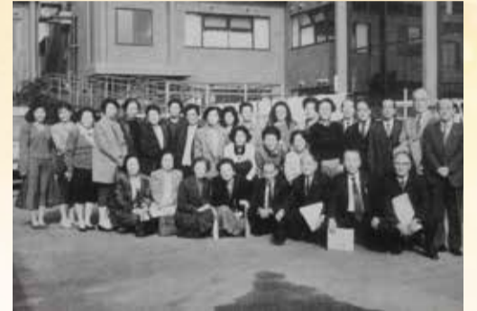
小地域福祉圏推進委員の皆さま

先生には、地域で、どう子どもを育てるか、子育てを子育て世代のみのこととしてとらえずに、地域に住むすべての方々、取り分け、子育て経験の豊かな高齢の方々が生きがいを感じつつ、子育てに関わる事、それにより、地域共生社会の実現につながるためにどうすれば良いのかといった観点から、お話を伺います。