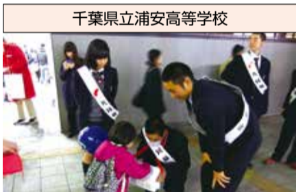
千葉県立浦安高等学校

終わるころには、声をからし、寒風に体をふるわせながらも、街頭募金に参加できた感謝の気持ちを伝える野球部員の礼儀正しさには感銘を受けました。その気持ちは、街頭の人たちにも伝わり、毎年、野球部の担当する時間には、多くの募金が集まります。