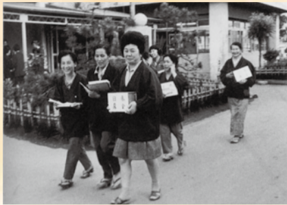
婦人の会の募金活動 (昭和46年頃)