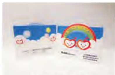
新しい社協募金箱