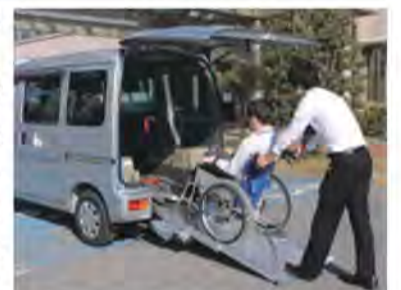
皆さんの外出をスロープ付き福祉車両「ハートフル号」がお手伝い

歳末たすけあい募金は、集まった募金のすべてが浦安市内で使われます。住み慣れた場所で安心して新しい年を迎えられるよう、障がい児や交通遺児世帯等への援護金配付やひとり暮らし高齢者への年賀状送付等に活用されています。福祉車両等の貸出にも活用され、利用された方からは「施設入所している妻の外出の機会を与えていただきありがとうございます」との温かいお言葉をいただきました。