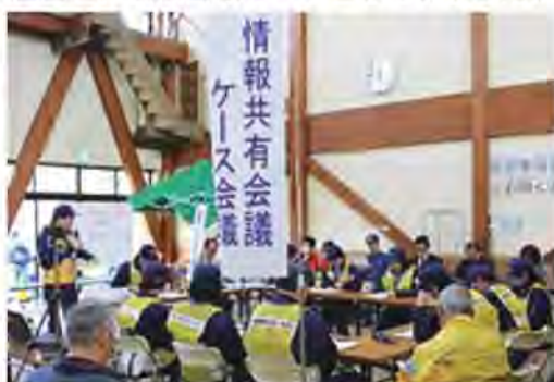
聞き取り方法をみんなで共有

ニーズ・相談の聞き取り後、当日の相談内容について、スタッフ全員で共有し、災害ボランティアセンターのみでは対応が難しいケース(相談)については、ミニケース会議を開いて対応を検討しました。ニーズとしては、雨漏りの応急処置の相談としていたものが、地震(余震)による不安や