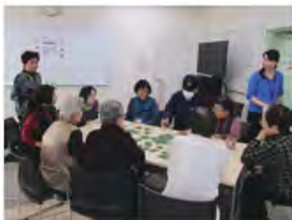
カルタとりでわいわい

赤い羽根共同募金は、集まった募金の7割が2019年度に浦安市内の地域福祉活動に使われます。主な使い道としては「ひとり暮らしの高齢者等への食事サービス」「地域福祉活動の拠点づくり事業(ぽっかぽか運営)」「市内の障がい・ひとり親家庭等の福祉団体活動助成」等です。ぽっかぽかを利用されている方は、「ここに居ると、家族と一緒に居るみたい」と話され、地域の大切な居場所となっています。