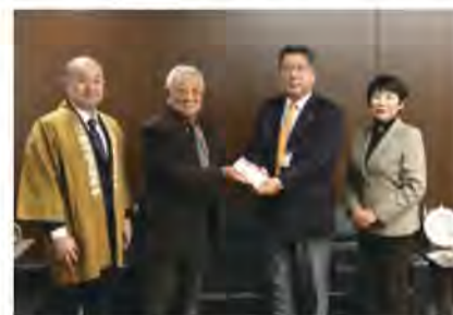
市長室にて寄付贈呈式

小学校で子どもたちに教える活動もしており、これからも伝統的な浦安囃子が継承されていくものと思います。