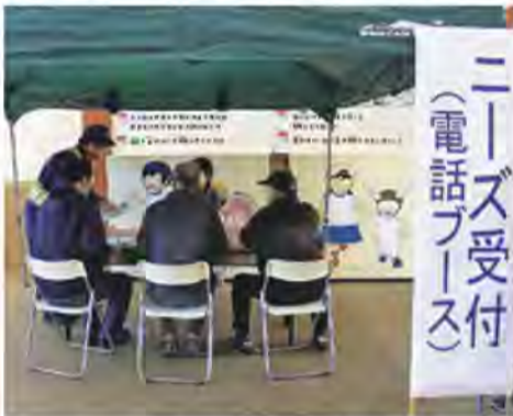
ロールプレイでニーズの聞き取り

2月24日(日)、若潮公園・交通公園にて、浦安市災害ボランティアセンターの移行・運営訓練を行いました。この若潮公園・交通公園は、災害発生時に災害ボランティアセンターの設置が予定されています。今年度は、災害ボランティアの受入・対応訓練ではなく、被災された方のお困り事(ニーズ)の聞き取りを中心とした訓練を実施しました。これは、発災時、被災された方の目に見えやすいニーズだけでなく、生活課題などの潜在的なニーズを見いだすことを目的としています。