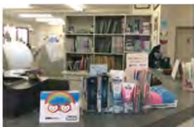
三浦歯科医院(今川1-2-1)に設置された募金箱

市民の皆さんの社協募金箱への温かいご協力をお願いします。また、法人・事業所の皆さんの社協募金箱の設置のご協力も併せてお願いします。設置いただける場合は、社会福祉協議会までご連絡ください。