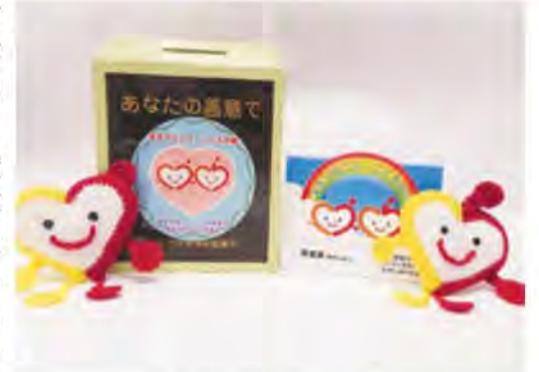
皆さんからのご支援を うらちゃんがお待ちしています

うらやす社協では、市内の公共施設や店舗、事業所のほか保育園や歯科医院にご協力をいただき、浦安市社協募金箱を設置しています。浦安市に暮らす皆さんが住み慣れた地域でこれからも安心して住み続けられるよう、うらやす社協では皆さんからの募金により、地域のボランティア活動やサロンなどに活用しています。