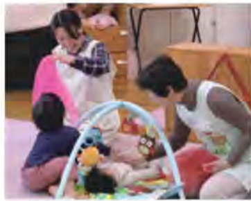
赤ちゃんも安心してスヤスヤ

2018年度に皆さんからいただいた会費は、皆さんの住む身近な「地域」の福祉活動に使われます。子育て中のパパママが安心して地域で子育てができ、高齢者が住み慣れた場所で元気に過ごしていけるためのサロンの開催、ボランティアを必要としている方とボランティアをしたい方とをつなげるボランティアセンターの運営等に活用されています。子育てサロンに参加したママからは「気軽に子育ての相談ができて、子どもを思いっきり遊ばせられるところが近所であってよかった」とママたちの居場所となっています。