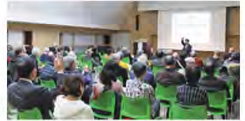
初めて聞く制度に皆さん真剣

3月6日(水)、中央公民館にて、『災害時の「生活再建制度」の知識と備え』と題して、平成30年度のわが家の防災講演会を開催しました。この講演会には、自治会、民生委員・児童委員の方も含め、70人の方に参加していただきました。