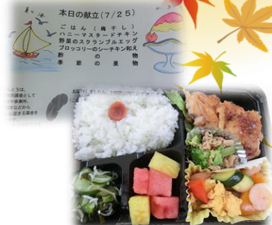
ぽっかぽかランチ