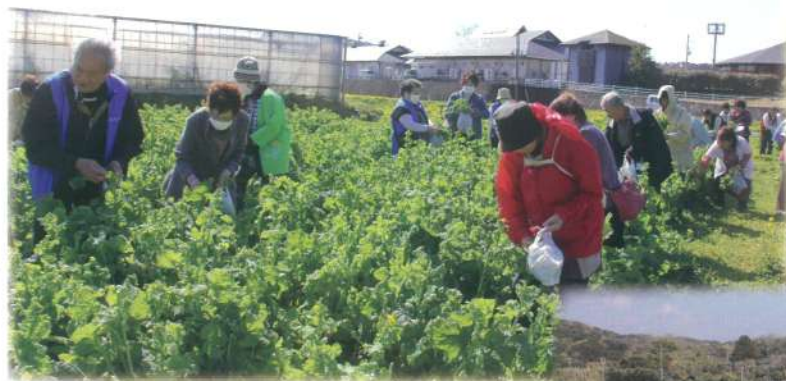
ビニール袋いっぱい