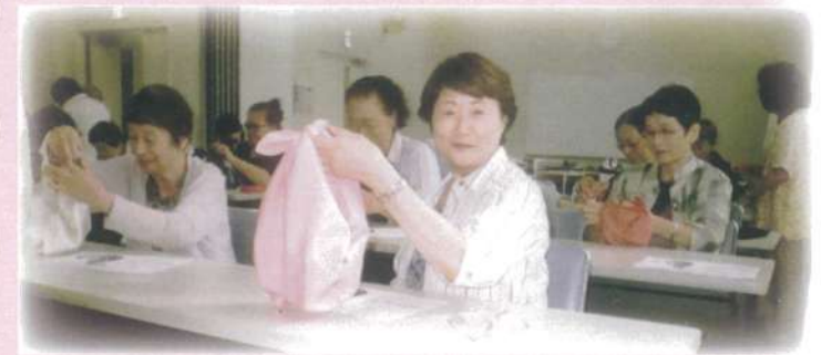
モダンバッグづくり