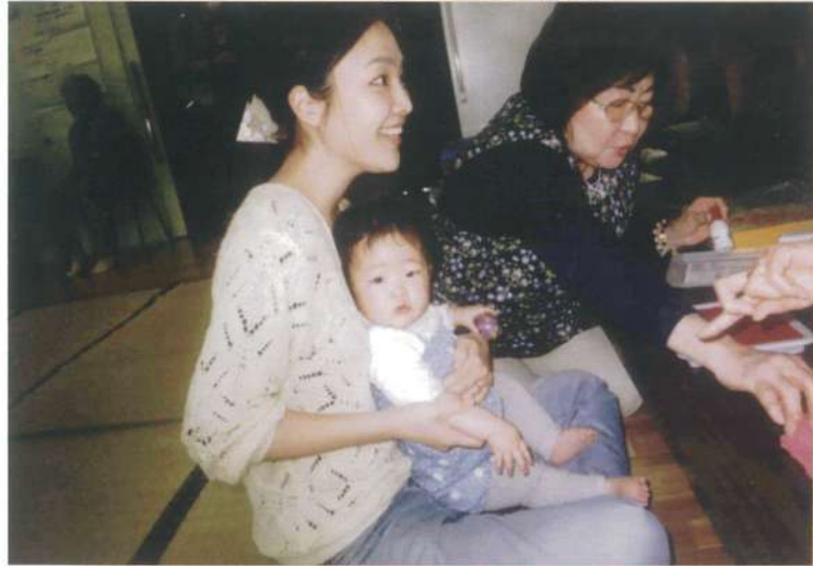
指導者のアドバイスに目も輝く