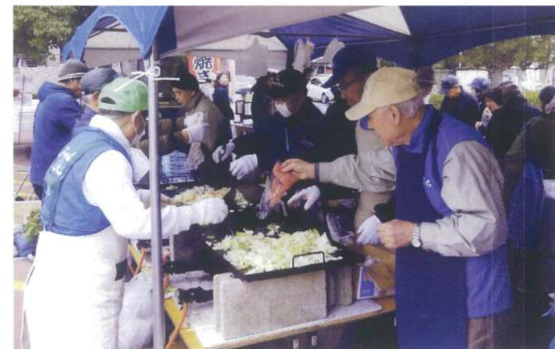
推進員が焼きそばづくり