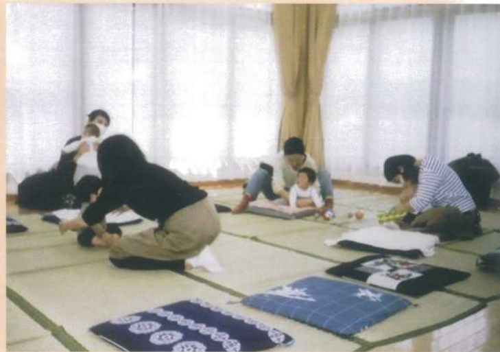
安心してわが子とのふれあい