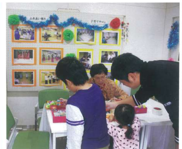
行事の写真や作品の展示