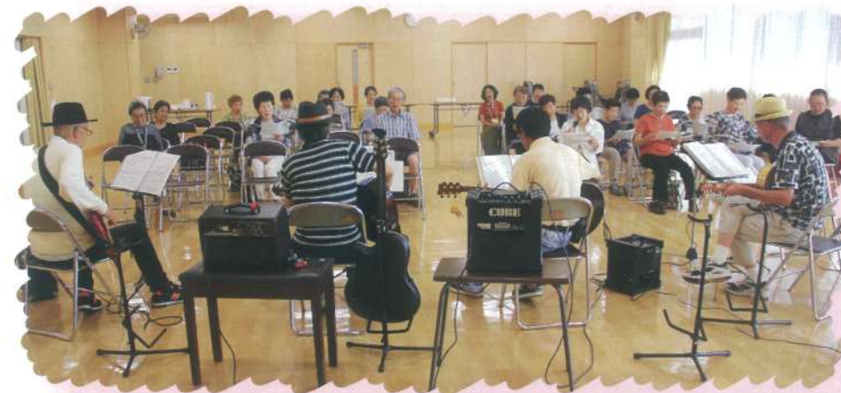
◀バンド演奏に合わせて歌う