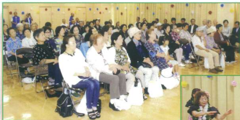
大勢の観客でにぎわう 堀江公民館大集会室

前任者の軌跡を参考に致し、西一支部の為微力ではありますが、皆さんと一緒に、西一支部の活動を盛り上げて行きたいと存じますので宜しくお願い致します。