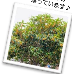
お庭の キンモクセイが とてもきれいな 季節です。 いい香りが 漂っています♪