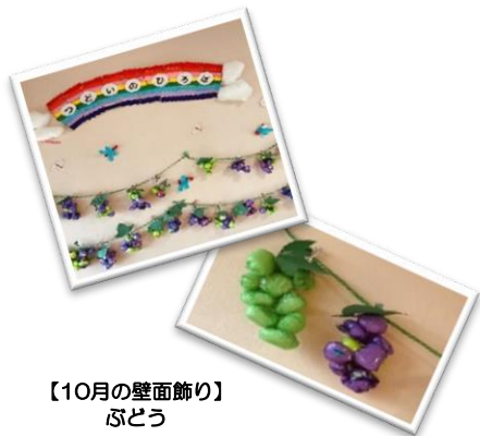
【10月の壁面飾り】 ぶどう