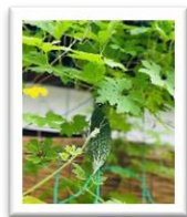
今年の ゴーヤも がんばりました！