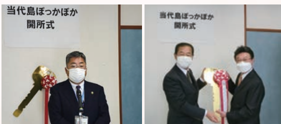
市長より開所祝いのお言葉をいただきました

当代島ぽっかぽかでは、地域の推進委員やスタッフが、皆様の来所を心よりお待ちしております。