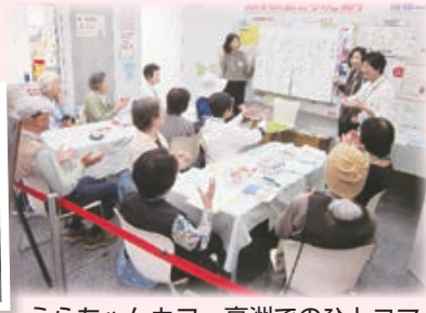
うらちゃんカフェ高洲でのひとコマ