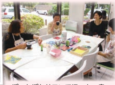
ぽっかぽかサロンでほっと一息