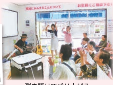
弾き語りで盛り上がる