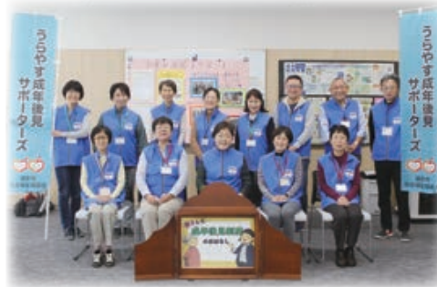
うらやす成年後見サポーターズのみなさん

令和3年10月時点で16人のサポーターズ、12人の後見支援員および3人の市民後見人が活動しています。