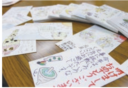
小中学生が作った高齢者へ送る年賀状