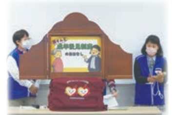
成年後見制度の紙芝居の様子