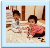
ずっと なかよくしようね！

まだ利用されたことのない方がいらしたら、ぜひ「新しい一歩」を踏み出してみてください！お待ちしております☆