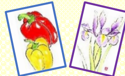
色鉛筆の絵はがき