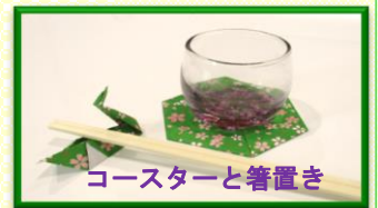
コースターと箸置き