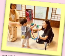
お手伝いできるよ！