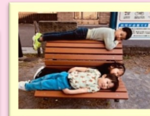
お兄さんが遊びに来て くれました