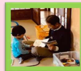
ブラレール先生と仲良し