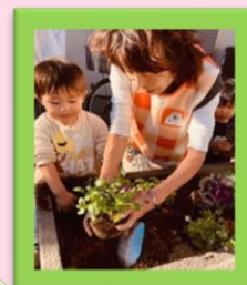
お花を植えました